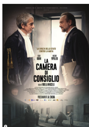
La Camera di Consiglio