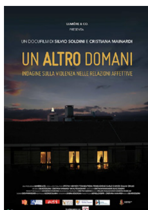
Un altro domani