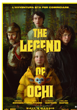
The Legend of Ochi