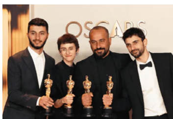
Registi del film No Other Land