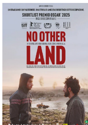
No Other Land