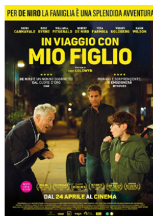
In viaggio con mio figlio