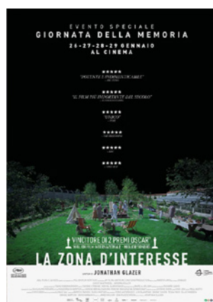
La zona d'interesse