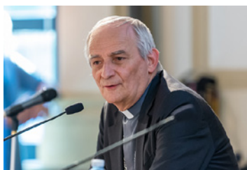
Matteo Maria Zuppi